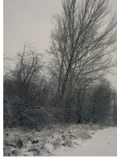
S/T Serie Los Hijos del Ciervo 2016-2020 Impreso en papel Hanhemüle Photorag Baryta 308gr/m2 Edición 5 + 2 PA 50 x 40 cm.