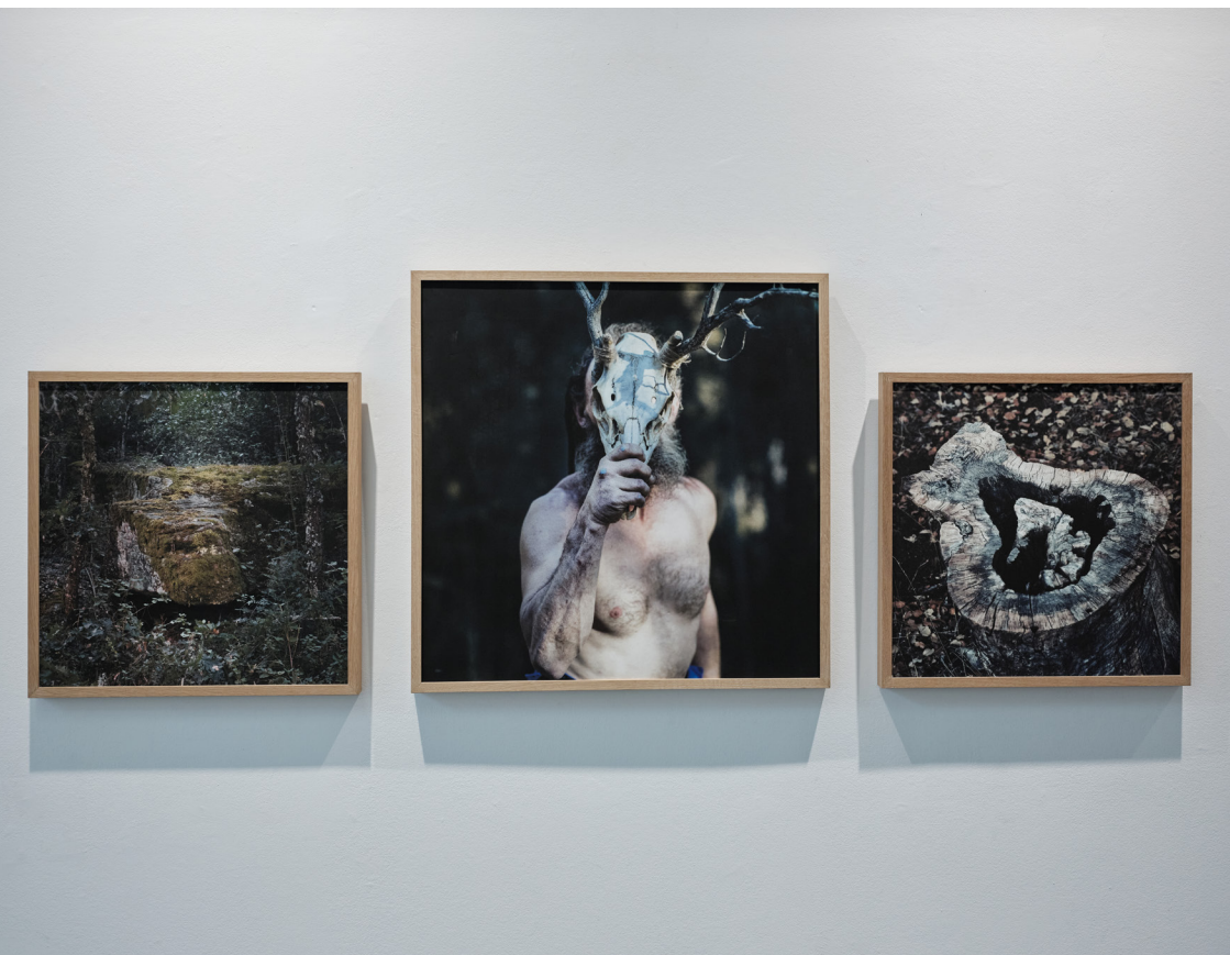
Exposición "Los Hijos del Ciervo: el regreso a casa" del fotógrafo José Luis Carrillo. Sala de exposiciones del Instituto Alicantino de Cultura Juan Gil-Albert

S/T Serie Los Hijos del Ciervo 2016-2020 Impreso en papel Hanhemüle Potorag Baryta 308gr/m2 Edición 5 + 2 PA 80 x 80 cm.