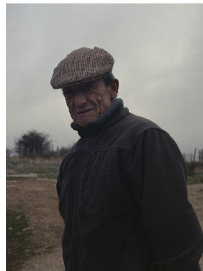
S/T Serie Los Hijos del Ciervo 2016-2020 Impreso en papel Hanhemüle Potorag Baryta 308gr/m2 Edición 5 + 2 PA 50 x 40 cm.