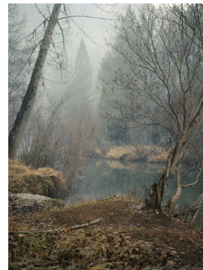
S/T Serie Los Hijos del Ciervo 2016-2020 Impreso en papel Hanhemüle Potorag Baryta 308gr/m2 Edición 5 + 2 PA 50 x 40 cm.