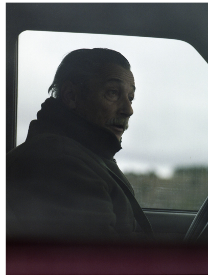
S/T Serie Los Hijos del Ciervo 2016-2020 Impreso en papel Hanhemüle Photog Baryta 308gr/m2 Edición 5 + 2 PA 50 x 40 cm.