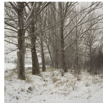
S/T Serie Los Hijos del Ciervo 2016-2020 Impreso en papel Hanhemüle Photorag Baryta 308gr/m2 Edición 5 + 2 PA 40 x 40 cm.