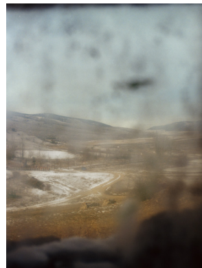
S/T Serie Los Hijos del Ciervo 2016-2020 Impreso en papel Hanhemüle Photorag Baryta 308gr/m2 Edición 5 + 2 PA 50 x 40 cm.