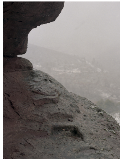
S/T Serie Los Hijos del Ciervo 2016-2020 Impreso en papel Hanhemüle Photog Baryta 308gr/m2 Edición 5 + 2 PA 50 x 40 cm.