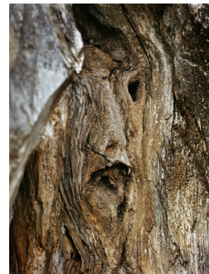
S/T Serie Los Hijos del Ciervo 2016-2020 Impreso en papel Hanhemüle Photorag Baryta 308gr/m2 Edición 5 + 2 PA 50 x 40 cm.