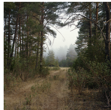
S/T Serie Los Hijos del Ciervo 2016-2020 Impreso en papel Hanhemüle Photorag Baryta 308gr/m2 Edición 5 + 2 PA 40 x 40 cm.