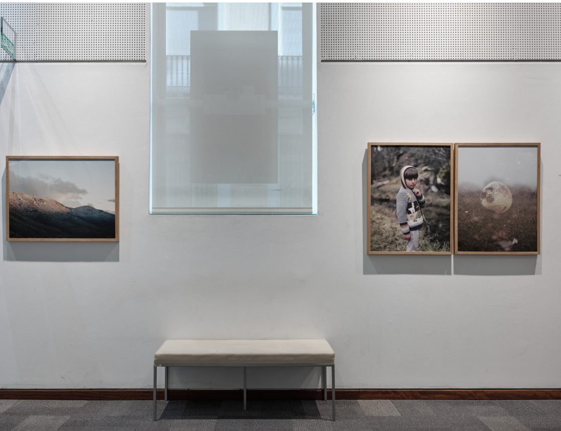
Exposición "Los Hijos del Ciervo: el regreso a casa" del fotógrafo José Luis Carrillo. Sala de exposiciones del Instituto Alicantino de Cultura Juan Gil-Albert