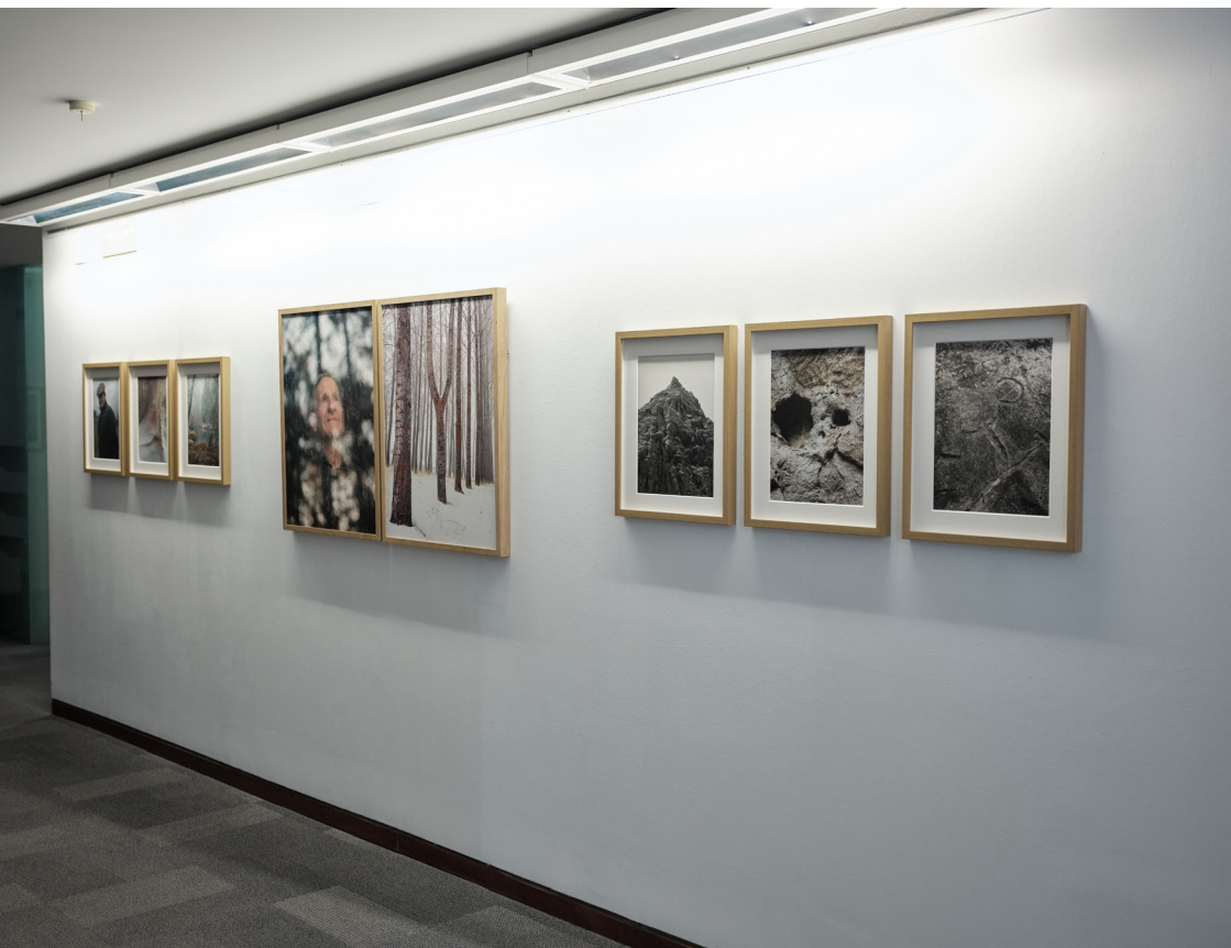
Exposición "Los Hijos del Ciervo: el regreso a casa" del fotógrafo José Luis Carrillo. Sala de exposiciones del Instituto Alicantino de Cultura Juan Gil-Albert