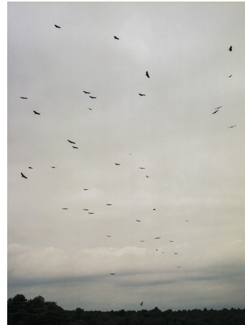
S/T Serie Los Hijos del Ciervo 2016-2020 Impreso en papel Hanhemüle Photrag Baryta 308gr/m2 Edición 5 + 2 PA 50 x 40 cm.