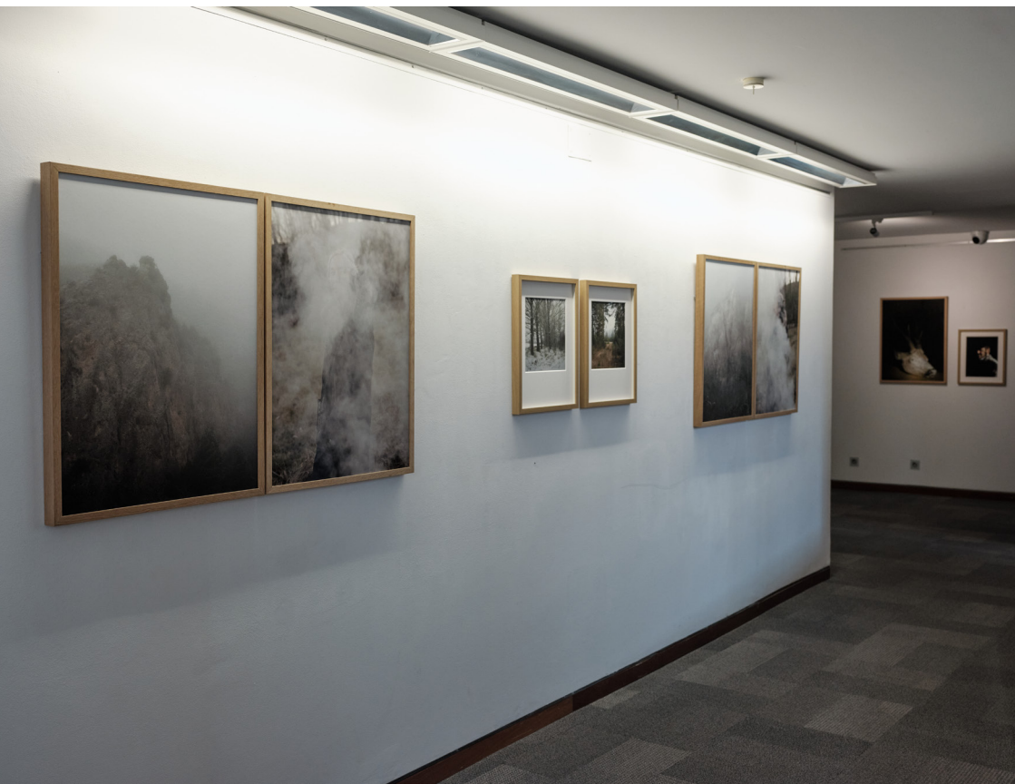
Exposición "Los Hijos del Ciervo: el regreso a casa" del fotógrafo José Luis Carrillo. Sala de exposiciones del Instituto Alicantino de Cultura Juan Gil-Albert