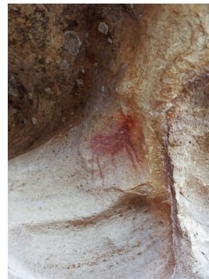
S/T Serie Los Hijos del Ciervo 2016-2020 Impreso en papel Hanhemüle Potorag Baryta 308gr/m2 Edición 5 + 2 PA 50 x 40 cm.