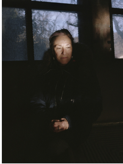
S/T Serie Los Hijos del Ciervo 2016-2020 Impreso en papel Hanhemüle Photorag Baryta 308gr/m2 Edición 5 + 2 PA 50 x 40 cm.