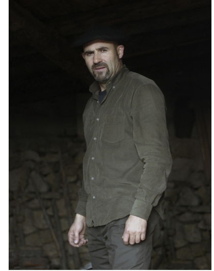
S/T Serie Los Hijos del Ciervo 2016-2020 Impreso en papel Hanhemüle Photorag Baryta 308gr/m2 Edición 5 + 2 PA 50 x 40 cm.