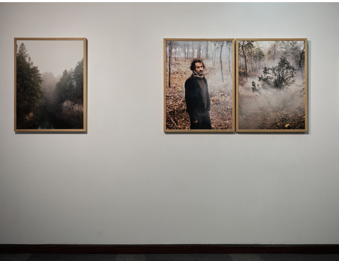
Exposición "Los Hijos del Ciervo: el regreso a casa" del fotógrafo José Luis Carrillo. Sala de exposiciones del Instituto Alicantino de Cultura Juan Gil-Albert