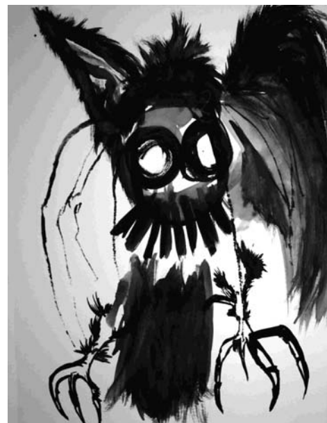
ESTUDIO DE MANCHA NEGRA N° 5_N° 6_N° 9_N° 10