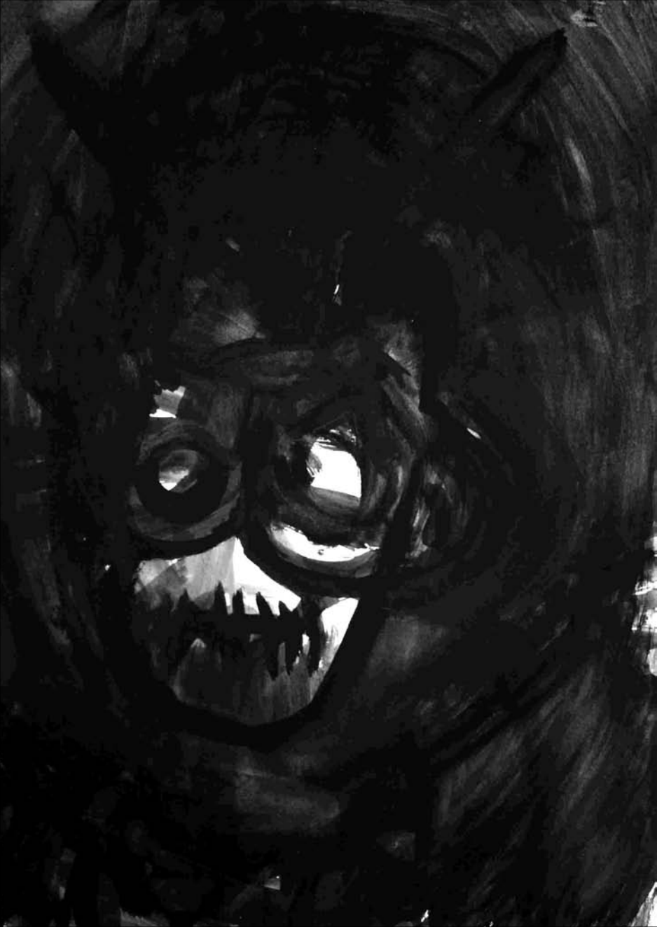
ESTUDIO DE MANCHA NEGRA N° 21 -gouache sobre papel 42x30 cm-2010