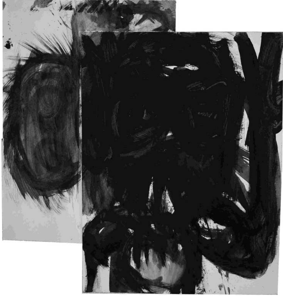
ESTUDIO DE MANCHA NEGRA Nº 43 -gouache, tinta china sobre papel 40x34 cm -2010