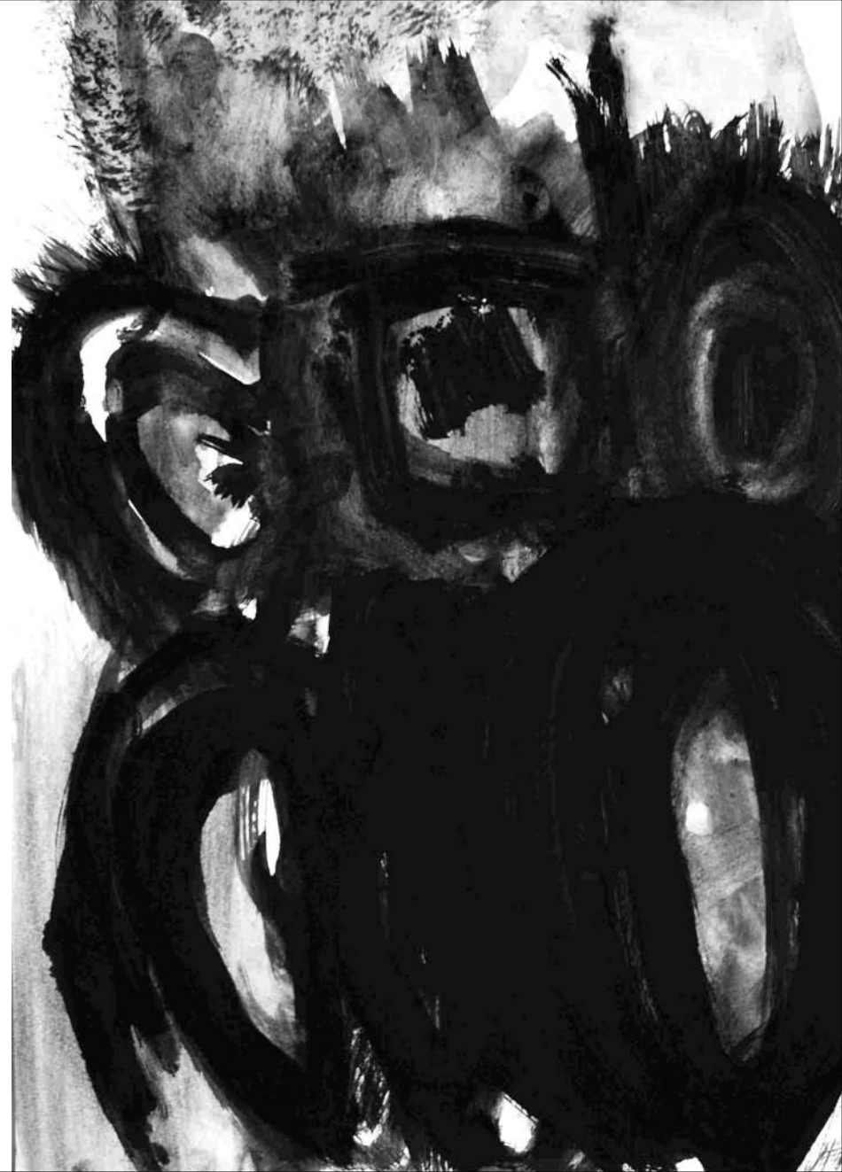
ESTUDIO DE MANCHA NEGRA Nº 30 -gouache sobre papel 42x30 cm-2010