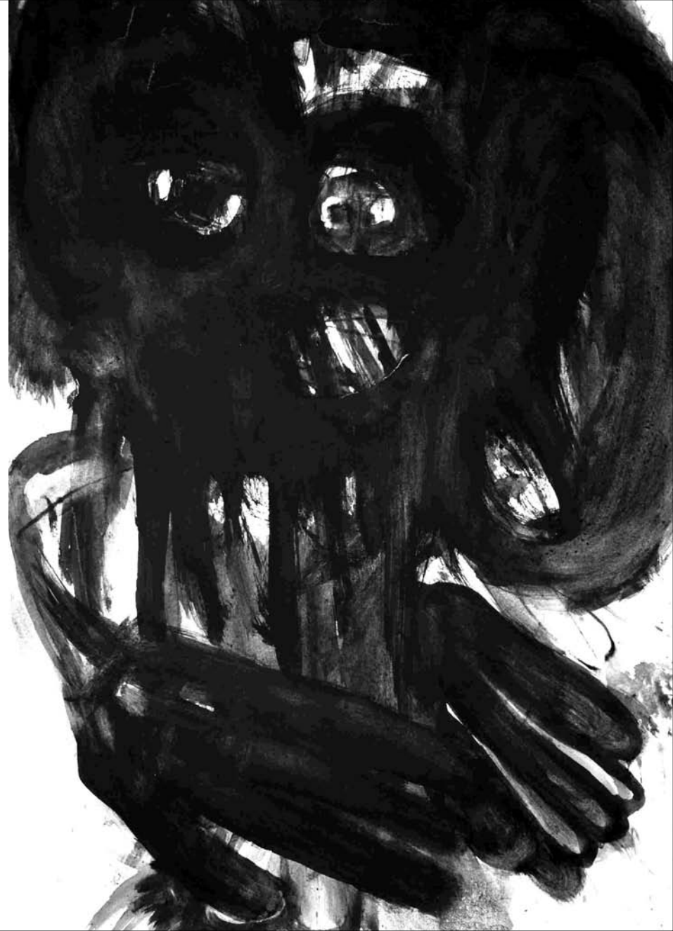
ESTUDIO DE MANCHA NEGRA N° 42 -gouache sobre papel 42x30 cm-2010