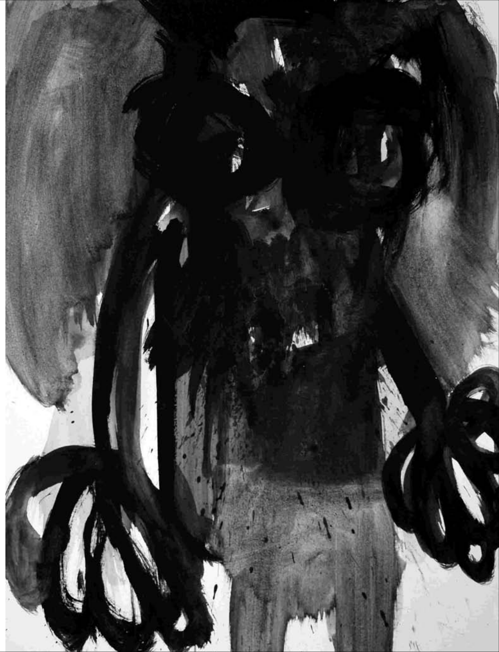
ESTUDIO DE MANCHA NEGRA Nº 38 -gouache sobre papel 32x24 cm-2010