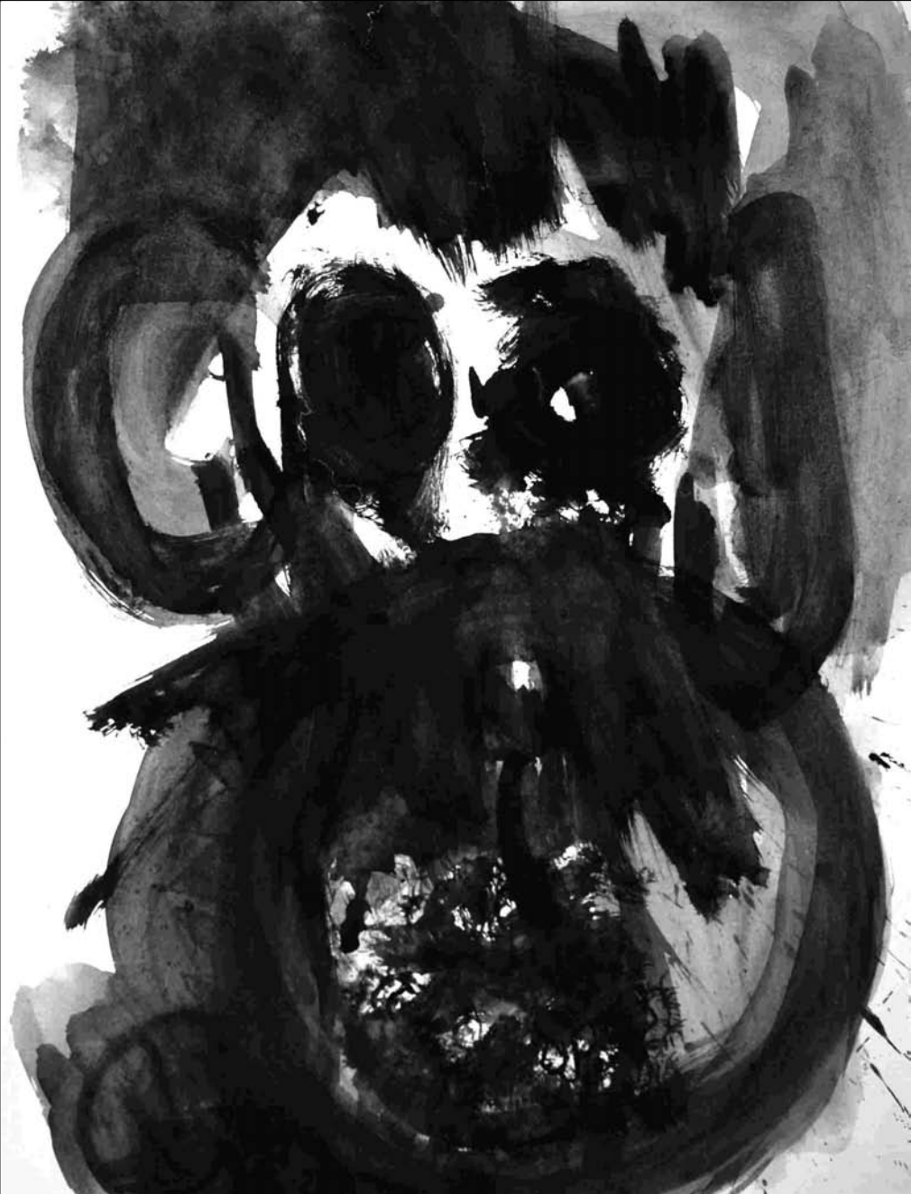
ESTUDIO DE MANCHA NEGRA Nº 37 -gouache sobre papel 32x24 cm-2010