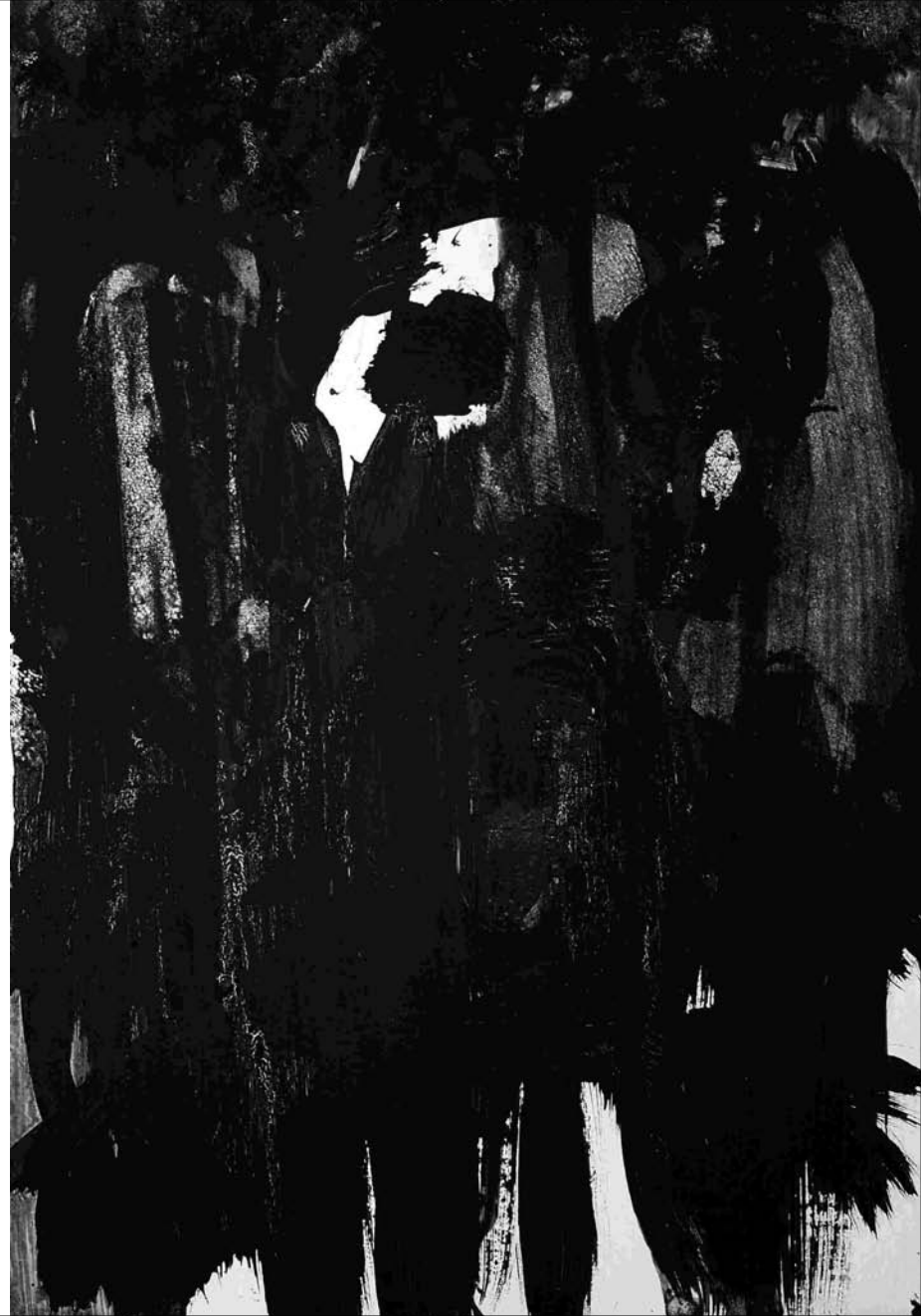
ESTUDIO DE MANCHA NEGRA tabilla Nº 5 -acrilico sobre tabilla 20x14 cm-2011