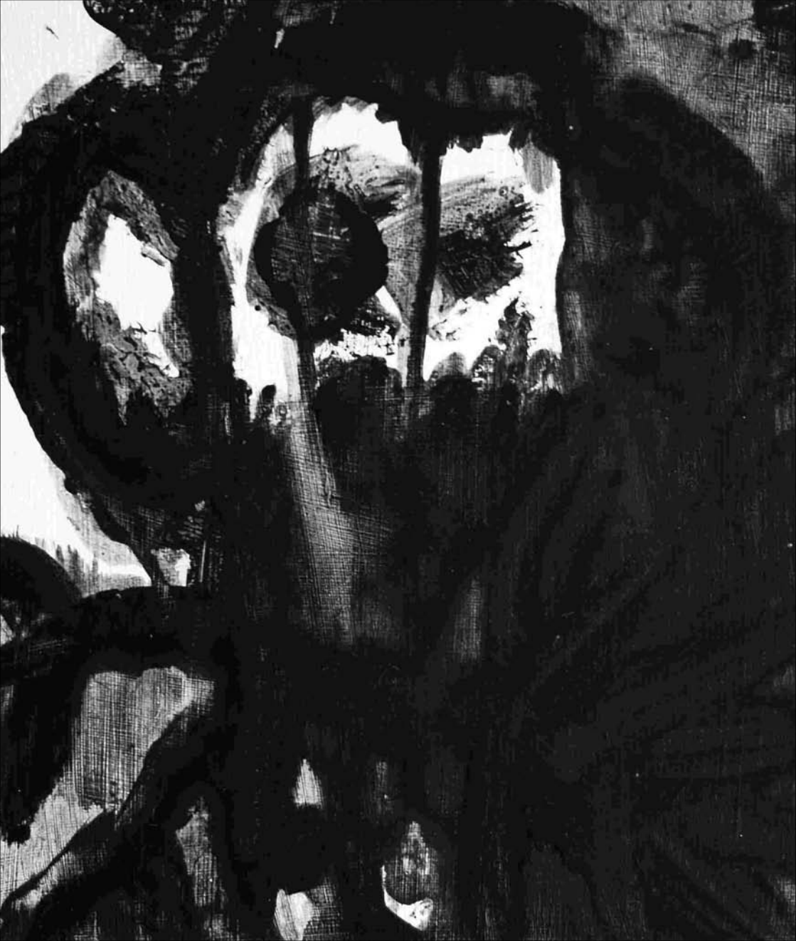
ESTUDIO DE MANCHA NEGRA tabilla Nº 3 -acrilico sobre tabilla 14x12 cm-2011