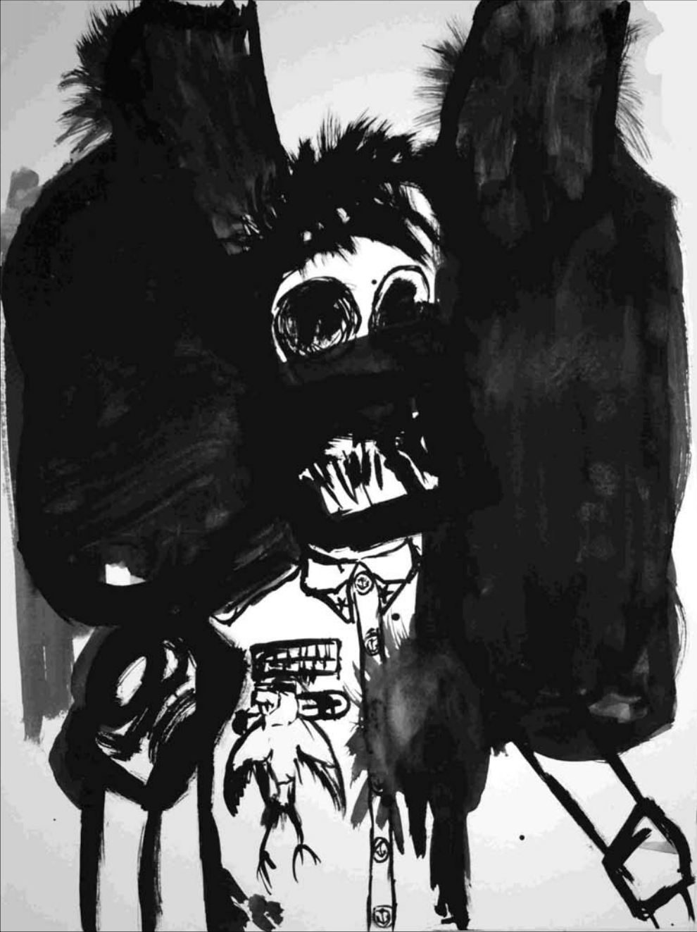
ESTUDIO DE MANCHA NEGRA N°-2. -gouache, tinta china sobre papel 32x24 cm-2010