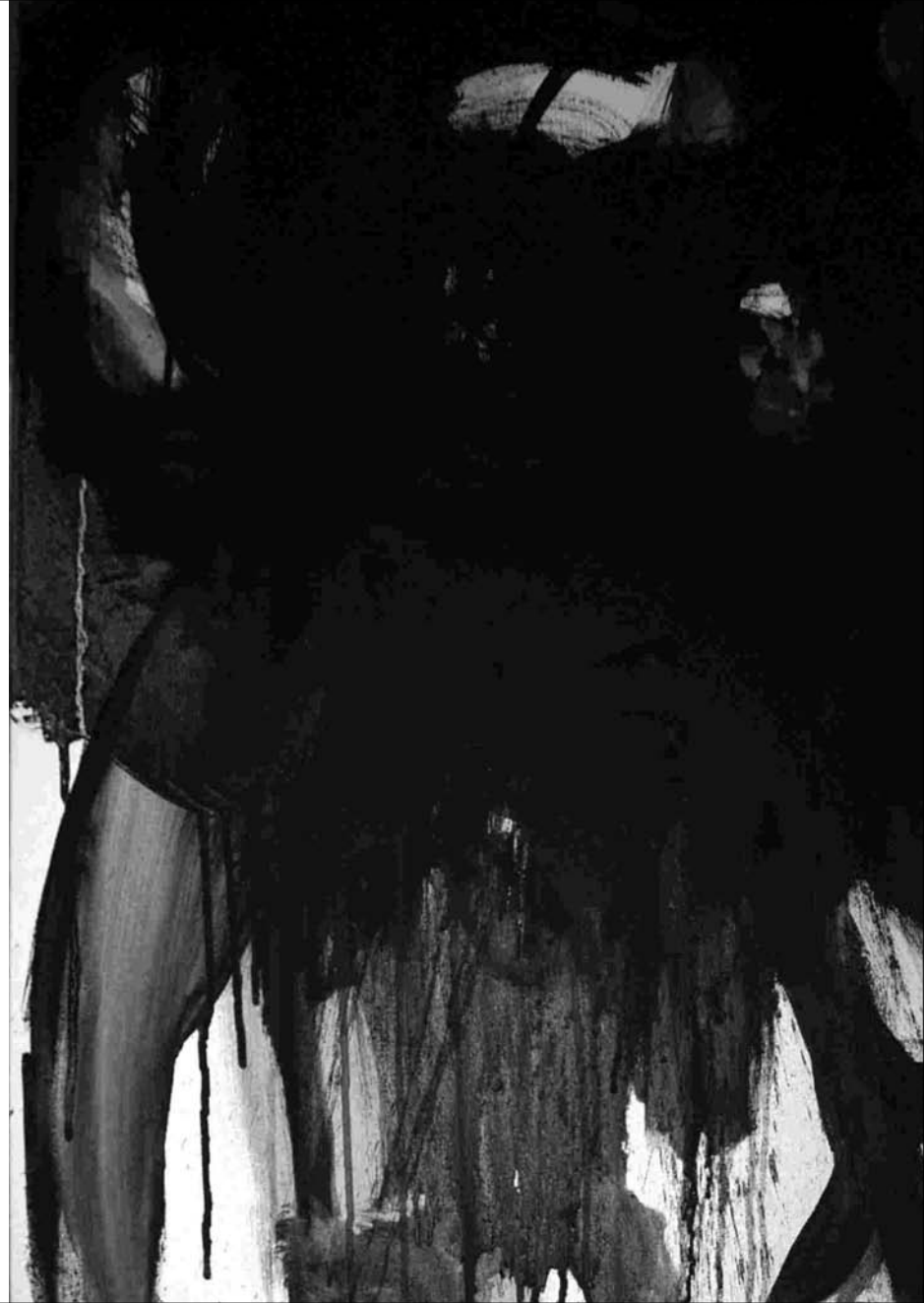
ESTUDIO DE MANCHA NEGRA lienzo Nº 3 -acrilico sobre lienzo 73x50 cm-2011