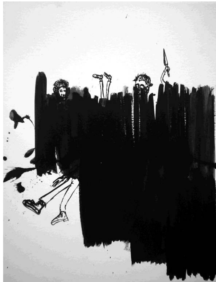
ESTUDIO DE MANCHA NEGRA N°-1. -gouache sobre papel 32x24 cm-2010