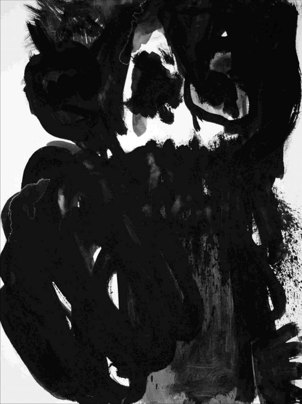
ESTUDIO DE MANCHA NEGRA Nº 29 -gouache sobre papel 32x24 cm-2010