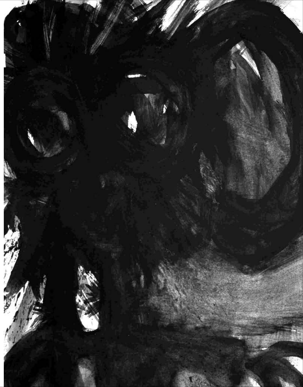
ESTUDIO DE MANCHA NEGRA Nº 40 -gouache sobre papel 32x24 cm-2010