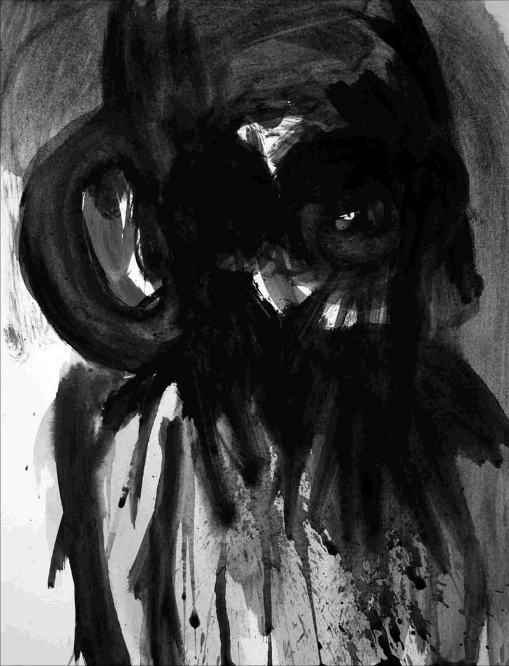
ESTUDIO DE MANCHA NEGRA Nº 39 -gouache sobre papel 32x24 cm-2010