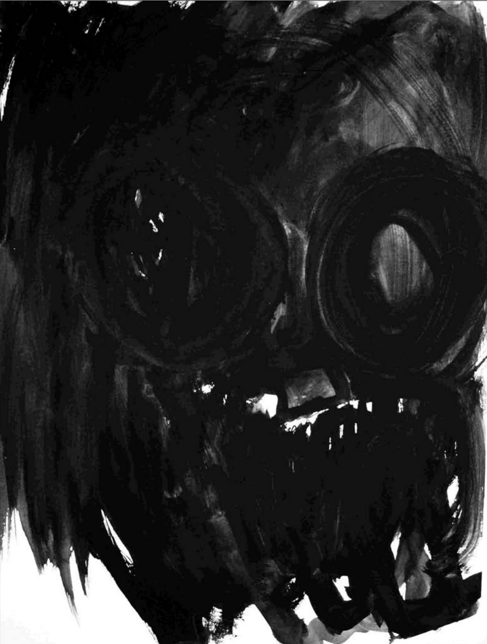
ESTUDIO DE MANCHA NEGRA Nº 15 -gouache sobre papel 32x24 cm-2010