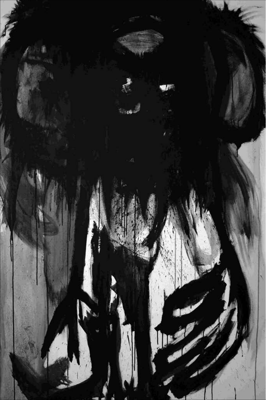
ESTUDIO DE MANCHA NEGRA lienzo Nº 1 -acrilico sobre lienzo 146x97 cm-2010