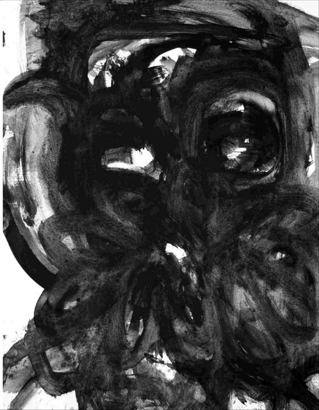
ESTUDIO DE MANCHA NEGRA Nº 45 -gouache, tinta china sobre papel 32x24 cm-2010