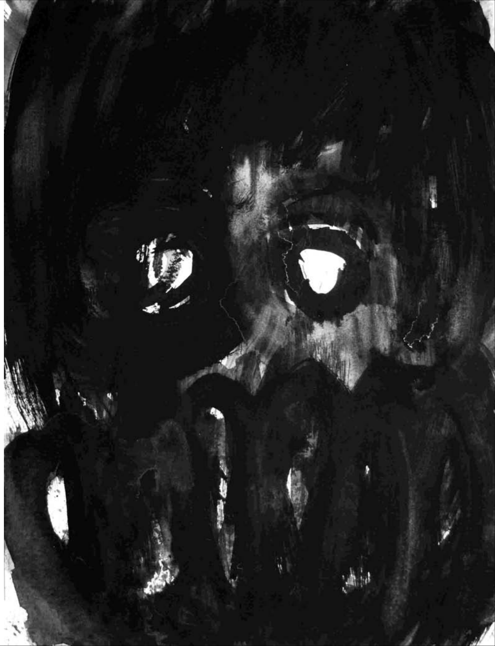
ESTUDIO DE MANCHA NEGRA Nº 28 -gouache sobre papel 32x24 cm-2010