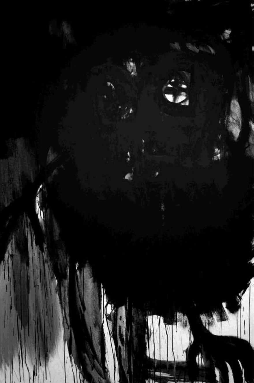
ESTUDIO DE MANCHA NEGRA lienzo Nº 4 -acrílico sobre lienzo 162x98 cm-2011