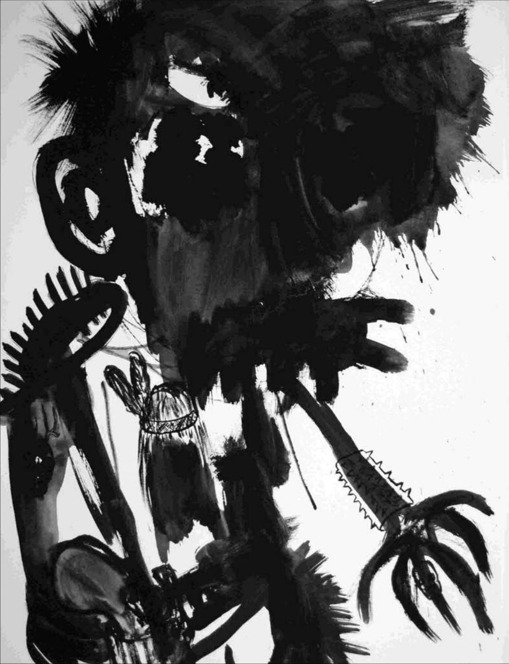
ESTUDIO DE MANCHA NEGRA Nº 27 -gouache, tinta china sobre papel 32x24 cm-2010