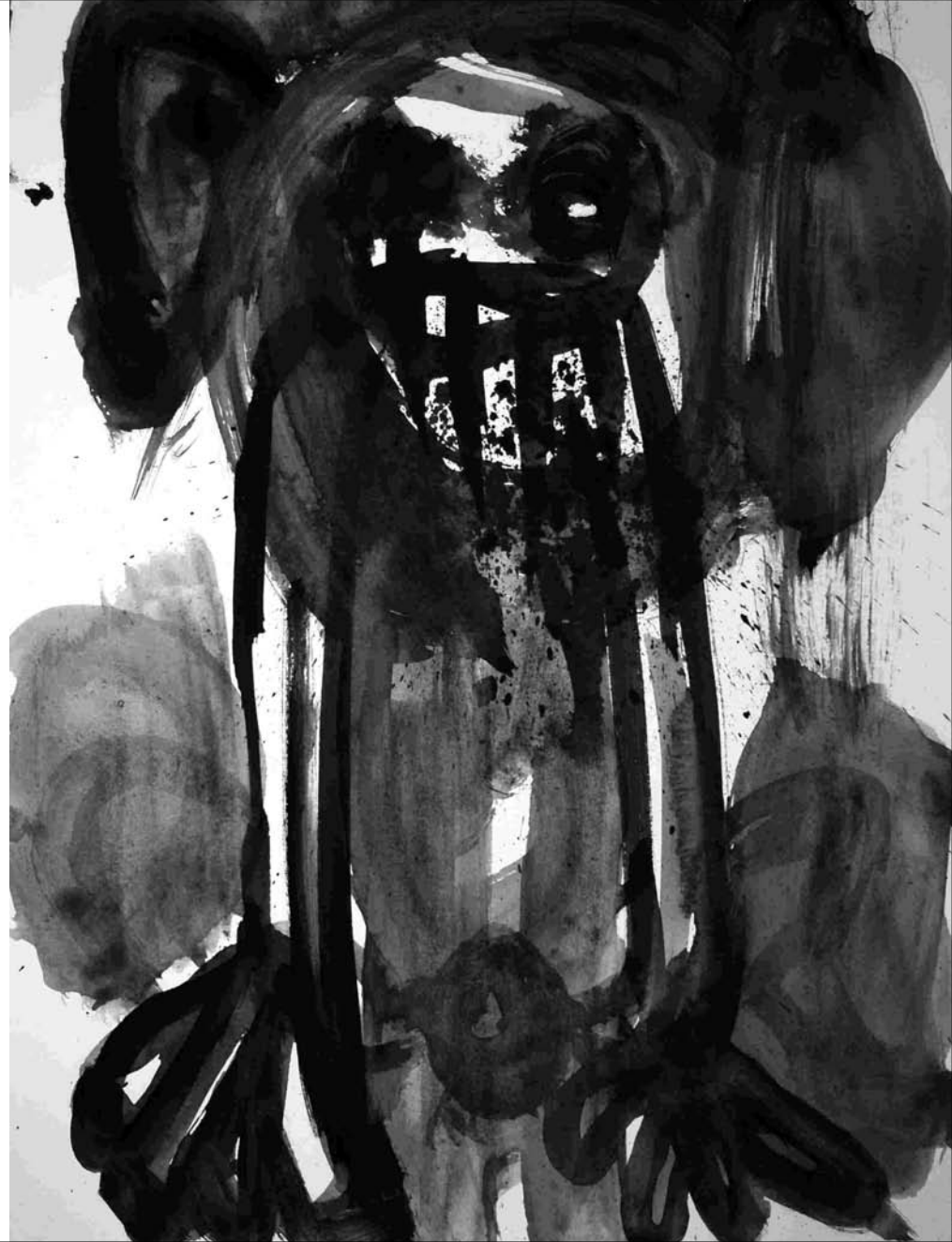
ESTUDIO DE MANCHA NEGRA N° 36 -gouache sobre papel 32x24 cm-2010