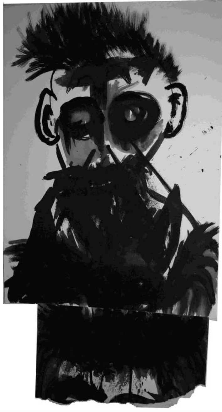
ESTUDIO DE MANCHA NEGRA N° 25 -gouache, tinta china sobre papel 51x30 cm-2010