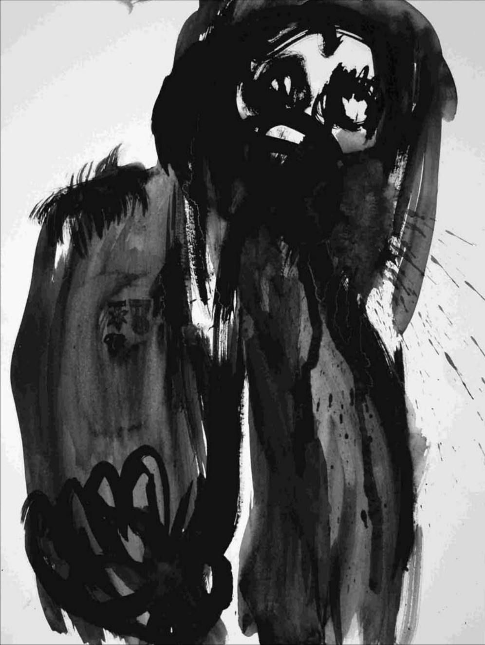
ESTUDIO DE MANCHA NEGRA N° 31 -gouache, tinta china sobre papel 32x24 cm-2010