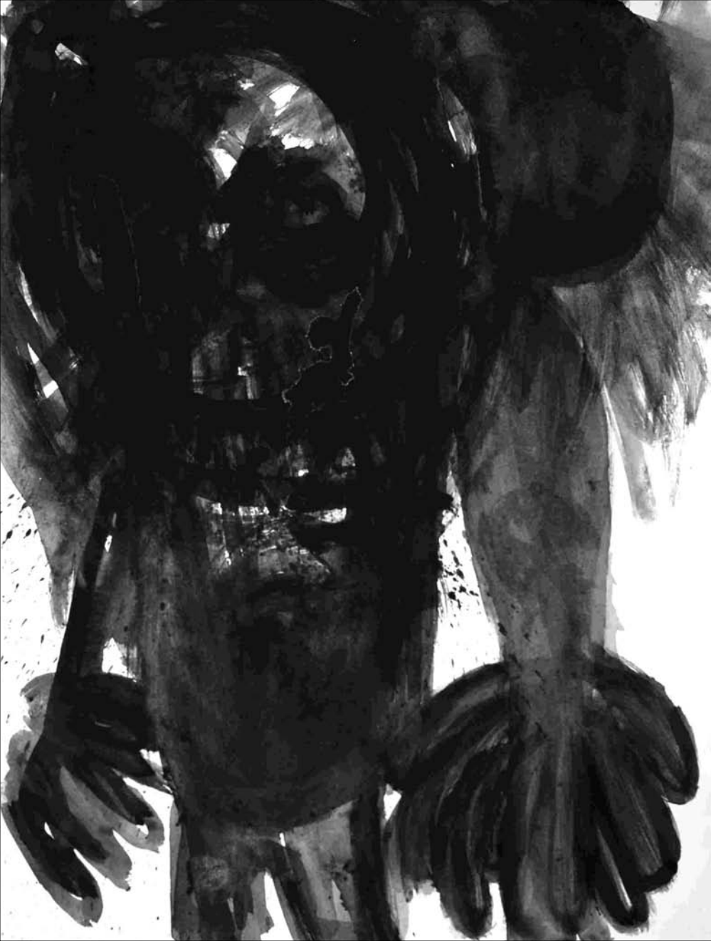
ESTUDIO DE MANCHA NEGRA N° 41 -gouache sobre papel 32x24 cm-2010