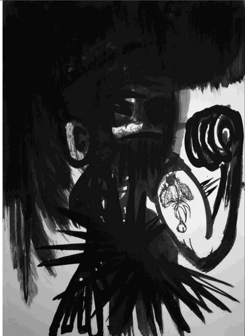
ESTUDIO DE MANCHA NEGRA Nº 19 -gouache, tinta china sobre papel 42x30 cm-2010