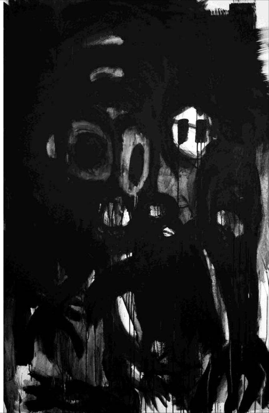
ESTUDIO DE MANCHA NEGRA lienzo Nº 5 -acrílico sobre lienzo 146x89 cm-2011