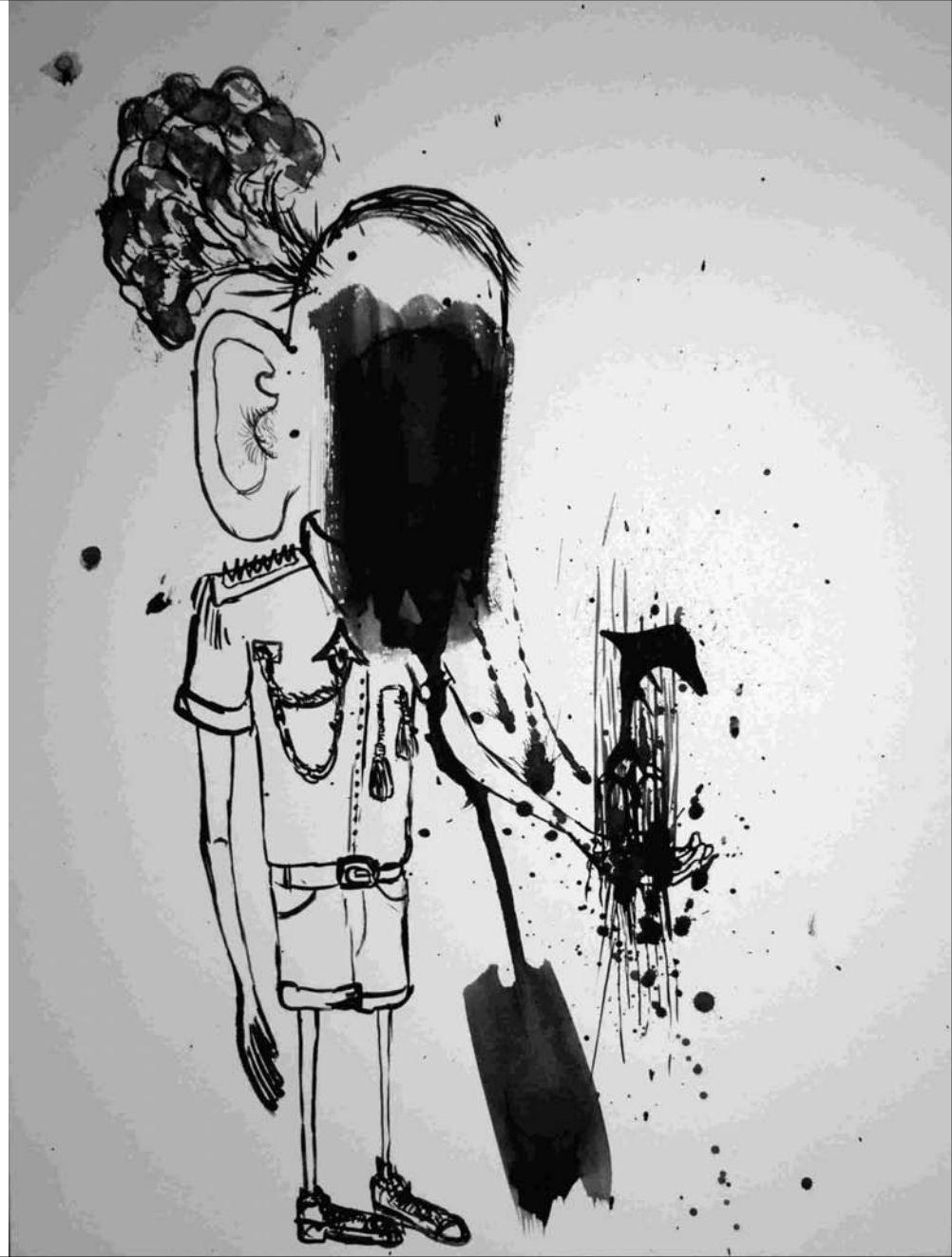
ESTUDIO DE MANCHA NEGRA N°-4. -gouache, tinta china sobre papel 32x24 cm-2010