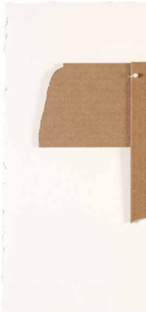
Ensamblaje: La amistad social II. 2011. (Serie Martillo Tourssin) Cartón craft sobre papel Canson Edition y bridas. 41 x 57,5 x 01 cm.