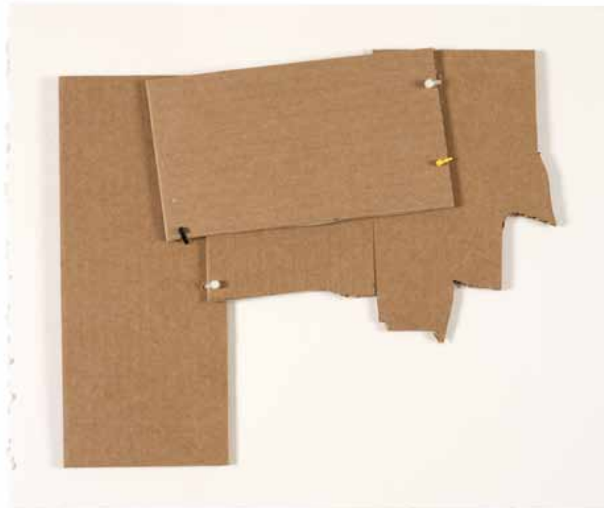
Ensamblaje: La amistad social. 2011. (Serie Martillo Tourssin) Cartón craft sobre papel Canson Edition y bridas. 35 x 40 x01 cm.