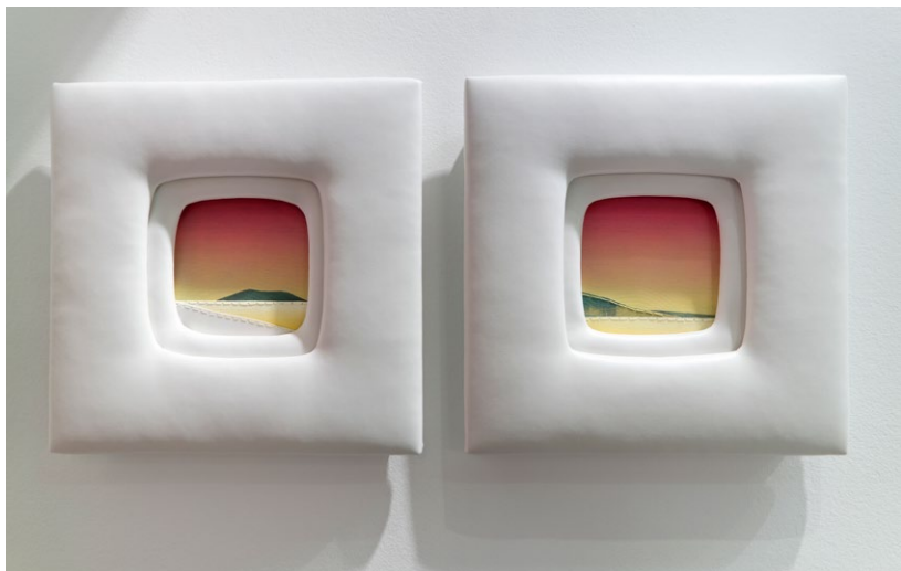
Observando el mundo 45 x 90. Acrílico, hilo y polipiel 2018