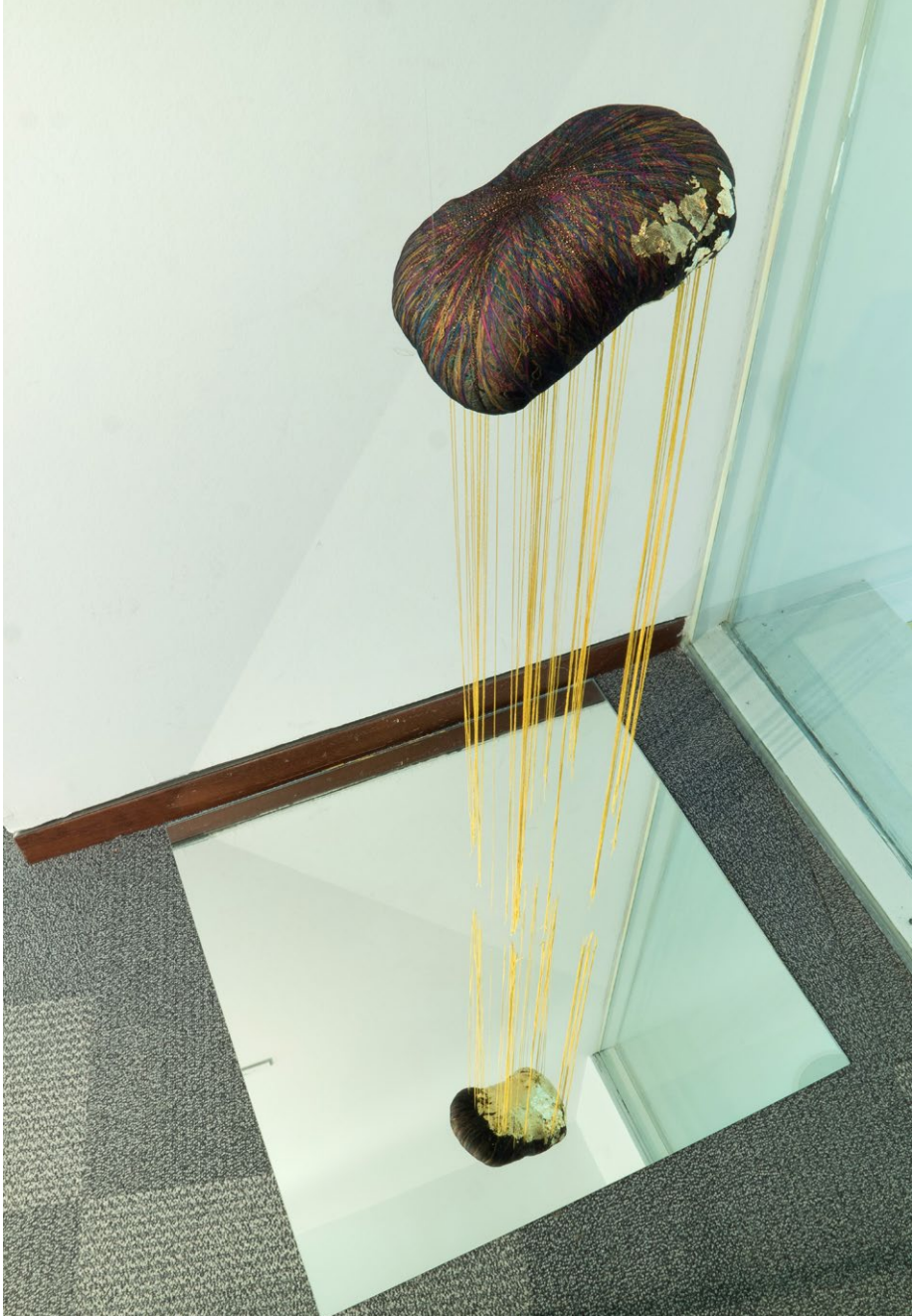
Todo está perfecto Espuma, hilo y poliéster. 2019