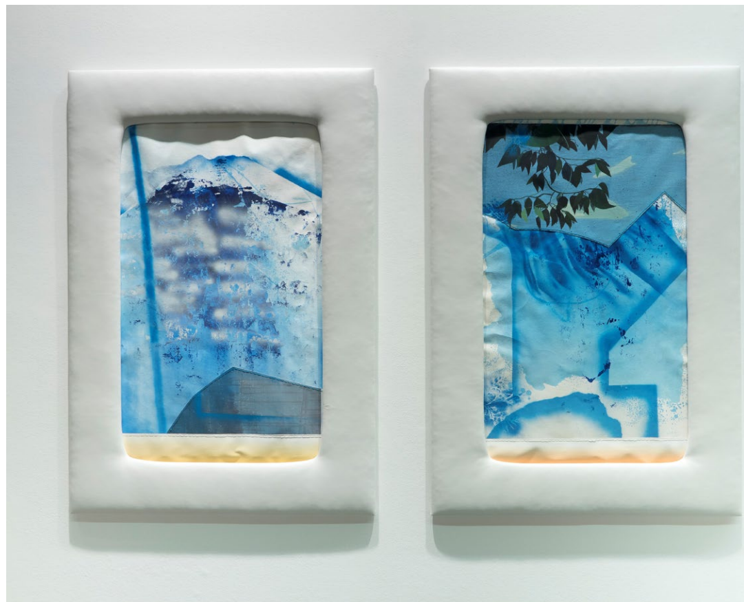
Cosidos 130 x 180. Papel, acrílico, hilo y polipiel 2018