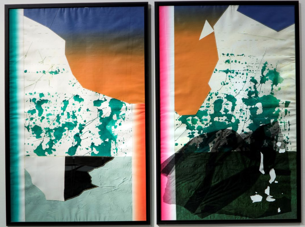
Dúo 146 x 180. Papel, tela acrílico e hilo. 2018